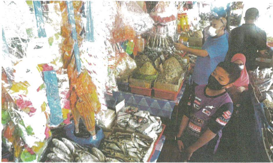
ORANG ramai memakai peltip muka sebagai mematuhi SOP yang ditetapkan bagi mengekang penularan Covid-19 ketika tinjauan di Arked Tanjung Dawai, di Kedah, semalam.

"Sekolah berkenaan sudah ditutup dan punca penularan masih dalam siasatan.