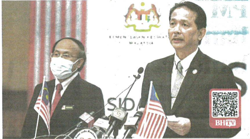
Dr Noor Hisham pada sidang media di Putrajaya, semalam.

Beliau berkata, sejak 3 April sehingga Ahad lalu, seramai 104,188 rakyat dan pemastautin tetap disaring, dengan 103,289 di kuarantin sama ada di rumah atau pusat kuarantin.