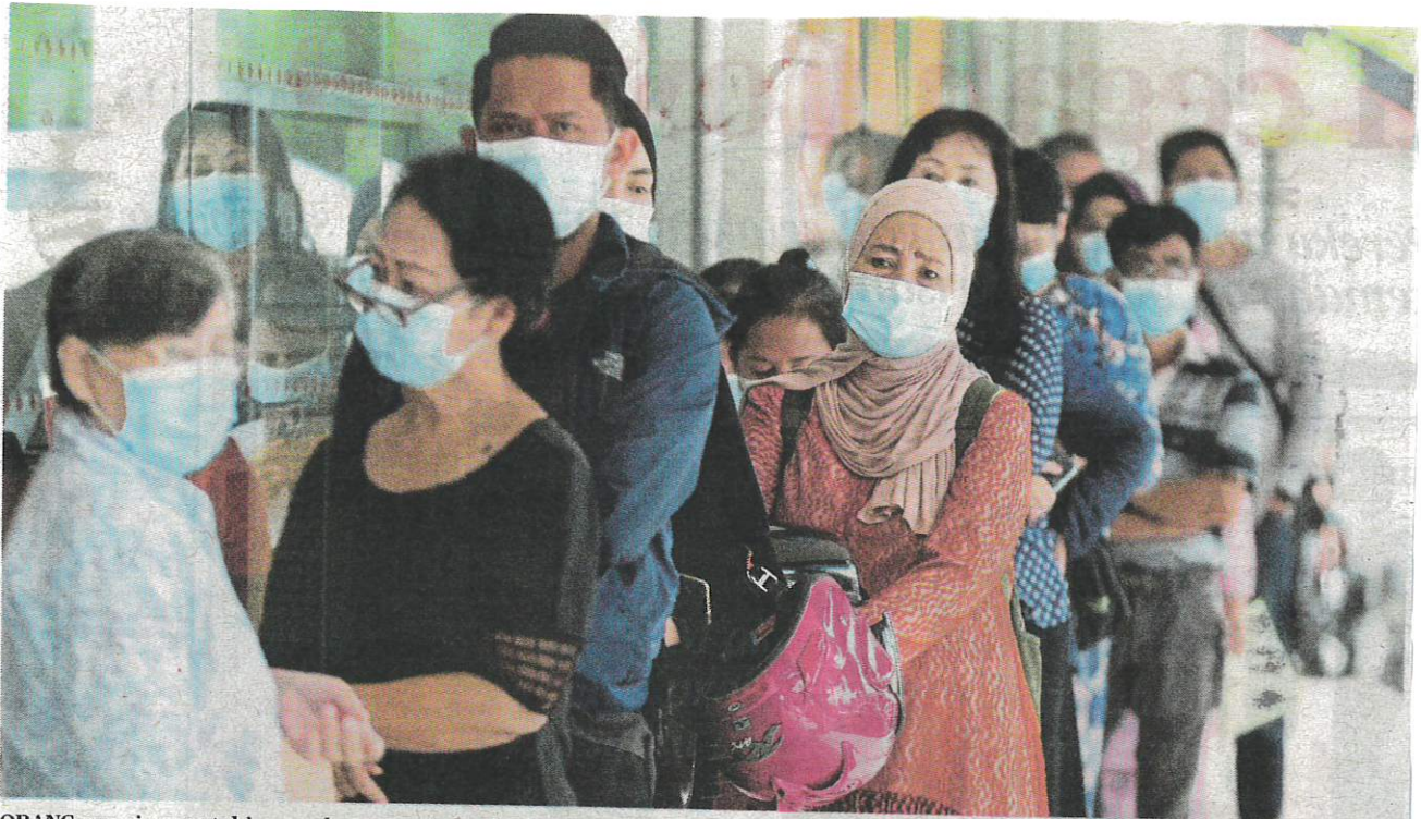
ORANG ramai mematuhi prosedur operasi standard (SOP) dalam norma baharu ketika berurusan di sebuah bank di Simping Tiga, Kuching, Sarawak, semalam.