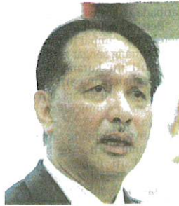
DR. NOOR HISHAM ABDULLAH

Tambah Dr. Noor Hisham, sekolah yang membabitkan pelajar itu telah ditutup dan kementeri-