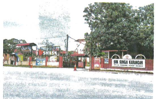
SMK Sungai Karangan yang ditutup sehingga 1 September depan susulan penularan Covid-19 bagi Kluster Tawar.

"Sekolah dibuka seperti biasa walaupun jumlah pelajar berkurangan," jelasnya.